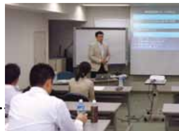
無料の勉強会で研鑽を